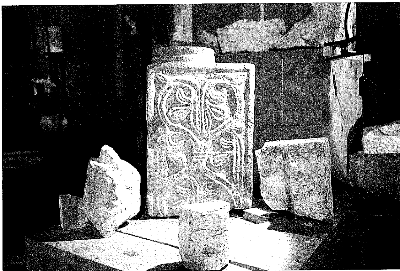
Pieve di Bigolio - Orzivecchi : Reperti rinvenuti durante lo scavo archeologico del 2018